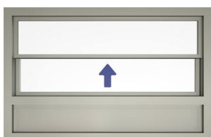
Tvådelad skjutlucka med fast aluminiumparti under