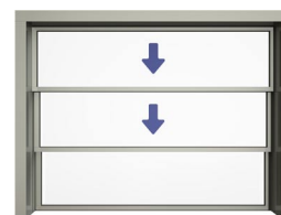
Tredelad nedåtgående skjutlucka